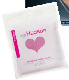
KUNERT FORMING EFFECT & myHudson

Während die Auslieferung der Herbst-/Winterkollektionen 2011/2012 sowie die Einführung der neuen Produktlinien unsere Umsatzerwartung deutlich übertroffen haben, entwickelten sich die Umsätze aus dem Sofortgeschäft bedingt durch anhaltend warme Temperaturen seit Anfang September nicht auf dem gewohnt hohem Level.